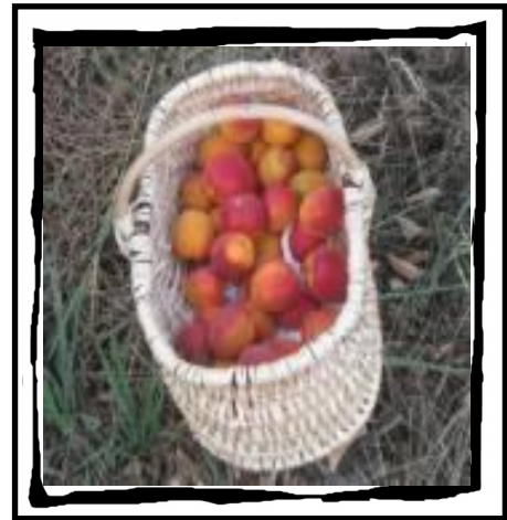
Les uns multiplient les pains, les autres les abricots...

Cordel écrit par Lucien Farhi et Danielle Stordeur collectif outils pour le soin, partage de savoirs d'accès libre. Juin 2015 http://www.outilsdusoin.fr/ Cordel 99 bis